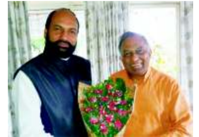
पद्मश्री एवं पद्मभूषण मा. श्री. विजय भटकरजी