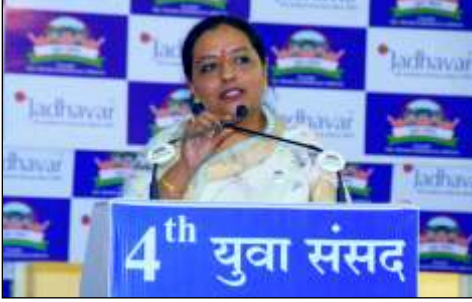
मा. अॅड. यशोमती ठाकुर (विधायक-तिवसा विधानसभा, अमरावती)