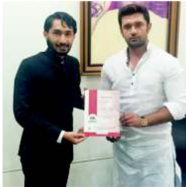
मा. श्री. चिराग पासवानजी सांसद (लोकसभा)