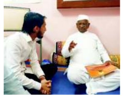
पद्मभूषित मा. श्री. अण्णा हजारेजी