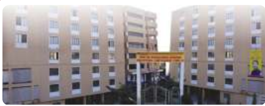
Prin. Dr. Sudhakar Rao Jadhavar Educational Campus (1), Narhe, Pune-41

Phone - 8459781648 www.jadhavarcbsc.co.in