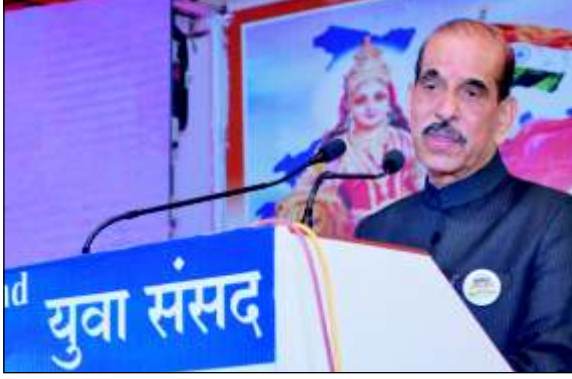
मा. श्री. मनोहररावजी जोशी (सर) (मा. मुख्यमंत्री-महाराष्ट्र राज्य, मा. सभापती-लोकसभा)