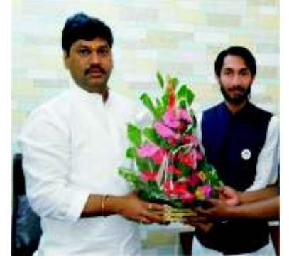
मा. श्री. धनंजय मुंडेजी विरोधी पक्ष नेता (विधान परिषद), महाराष्ट्र राज्य