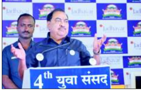
मा. श्री. एकनाथ खडसे – मा. महसूल मंत्री, महाराष्ट्र राज्य