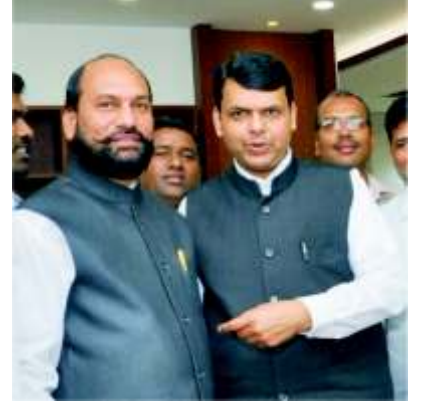
मा. श्री. देवेंद्र फडणवीसजी मुख्यमंत्री, महाराष्ट्र राज्य