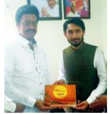
मा. श्री. अनिल शिरोळेजी सांसद, लोकसभा