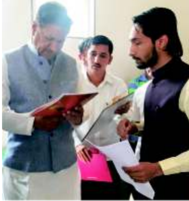
मा. श्री. पृथ्वीराज चव्हाणजी पूर्व मुख्यमंत्री, महाराष्ट्र राज्य