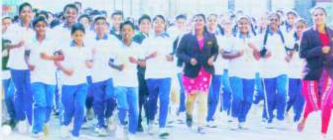
बायली : मॅरेथॉन करताना पुणे ज्यॉक इन्स्टिट्यूटचे जाधवर स्पोर्ट्स फेस्टिवलमध्ये सहभाग घेतले. छात्रांचे सहभागीत्वाचे सन्मानार्थे छात्रांचे फोटो.

३ मार्च : (पुणे) - पुणे येथील जाधवर स्पोर्ट्स इन्स्टिट्यूटचे विद्यार्थ्यांचा जाधवर स्पोर्ट्स फेस्टिवलमध्ये सहभाग घेतला. यावेळी विद्यार्थ्यांचा सहभाग घेऊन क्रीडा स्पर्धा व मॅरेथॉन आयोजित करण्यात आले. विजेत्या विद्यार्थ्यांचा गौरव करण्यात आला. जाधवर स्पोर्ट्स इन्स्टिट्यूटचे जाधवर स्पोर्ट्स फेस्टिवलमध्ये सहभाग घेतले. छात्रांचे सहभागीत्वाचे सन्मानार्थे छात्रांचे फोटो.