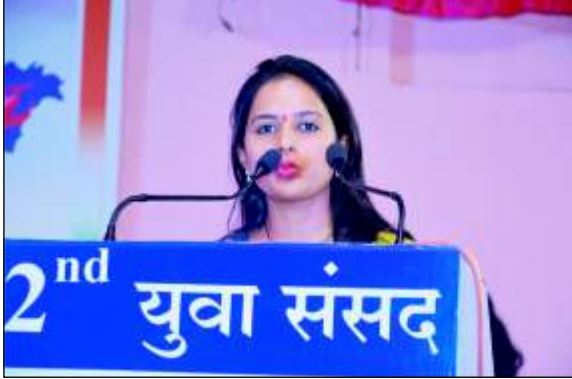
मा. प्रितमताई मुंडे - सांसद (बीड लोकसभा मतदार संघ)