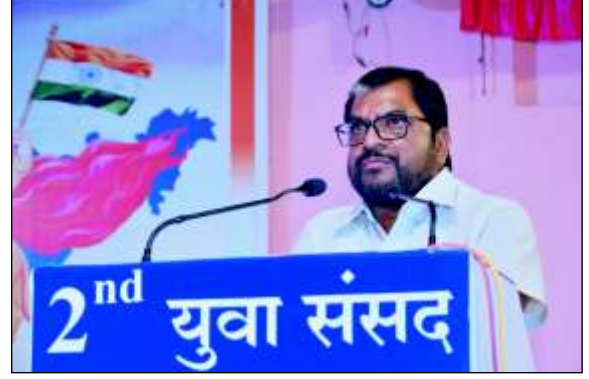
मा.श्री.राजू शेटी - सांसद (अध्यक्ष, शेतकरी स्वाभिमानी संघटना)