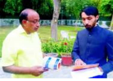
मा. श्री. विजय गोयलजी खेलमंत्री, भारत सरकार