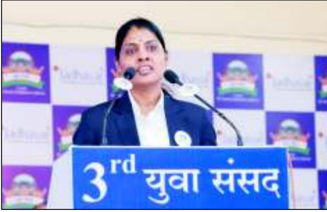
मा. श्रीमती ललिता बाबर (आशिया की सर्वोत्कृष्ट रनर)