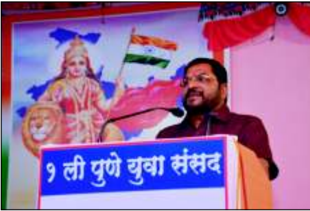
मा. श्री. राजू शेट्टी (सांसद, लोकसभा)