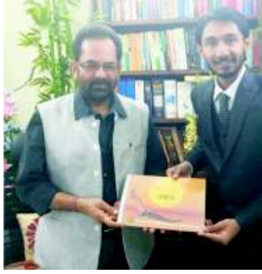
मा. श्री. मुख्तार अब्बास नकवीजी केन्द्रीय अल्पसंख्यांक मंत्री