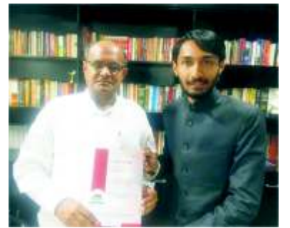
मा. श्री. के. सी त्यागीजी सांसद राज्यसभा अध्यक्ष - उदद्योग संबंधी स्थाई समिती