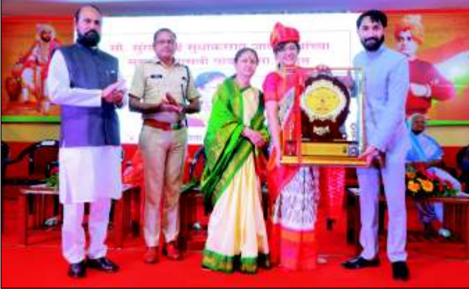
प्रमुख पाहुणे - मा. सौ. वंदना चव्हाण (सांसद-राज्यसभा)