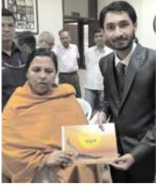
मा. सु.श्री. उमा भारतीजी केन्द्रीय जल संसाधन, नदी विकास और गंगा सफाई मंत्री