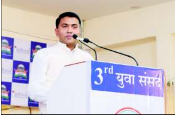
मा. डॉ. श्री. प्रमोद सावंत (मुख्यमंत्री, गोवा राज्य)