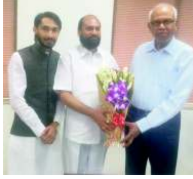
पद्म विभूषण मा. श्री. रघुनाथ माशेलकरजी