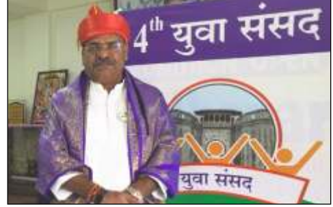
मा. श्री. शिवाजीराव अढळराव पाटील (सांसद-शिरूर लोकसभा मतदारसंघ)