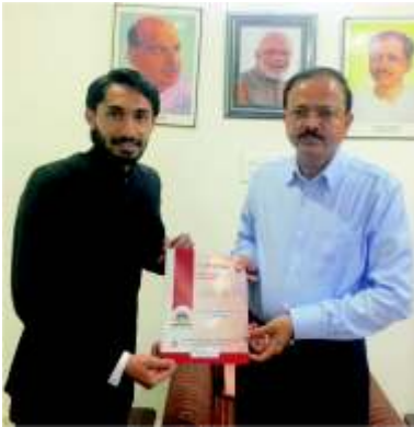
मा. श्री. सुभाष भामरेजी रक्षा राज्यमंत्री भारत सरकार