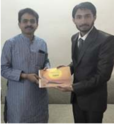
मा. श्री. राजीव सातवजी सांसद एवं राष्ट्रीय युवा कांग्रेस के भूतपूर्व अध्यक्ष